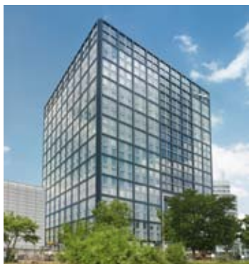
TRANSPARENT, EFFIZIENT, ÖKOLOGISCH: DIE NEUE BÖRSENZENTRALE.