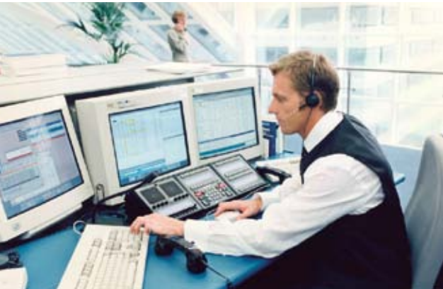
DIE ZUKUNFT BEGINNT: DAS ERSTE VOLLELEKTRONISCHE HANDELSYSTEM XETRA REVOLUTIONIERT DEN KASSAMARKT.