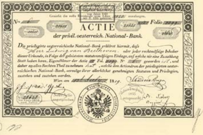
DIE ERSTE IN FRANKFURT GEHANDELTE AKTIE