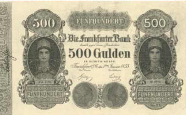
NOTE DER „FRANKFURTER BANK“ (1855)