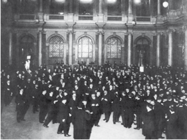
BÖRSENVERSAMMLUNG UM 1914