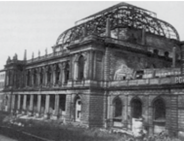
DIE ZERBOMBTE BÖRSE 1944