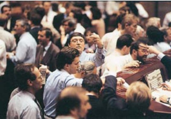
TERMIN AUF TERMIN: 1990 STARTET DIE DEUTSCHE TERMINBÖRSE