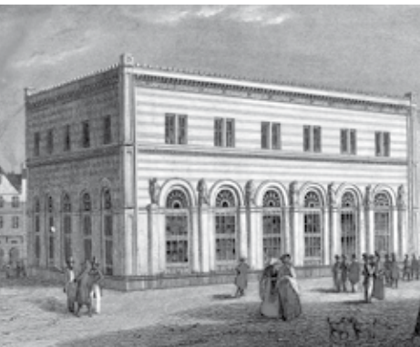
DIE „HISTORISCHE BÖRSE“ AM PAULSPLATZ (1845)