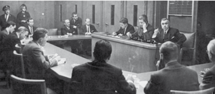
SITZUNG DER DEVISENBÖRSE MITTE DER 1960ER JAHRE