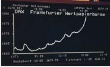
DAX: VOM START WEG UNANGEFOCHTEN