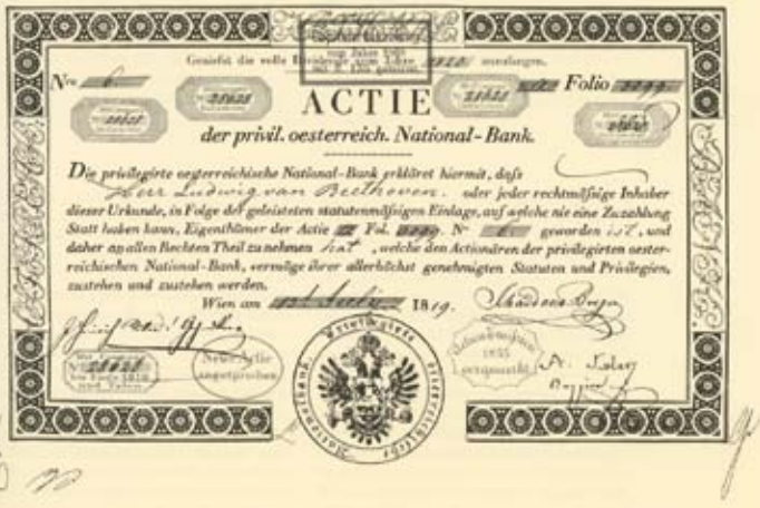
DIE ERSTE IN FRANKFURT GEHANDELTE AKTIE