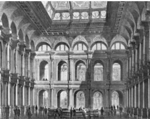
DIE NEUE ADRESSE AB 1879: BIS HEUTE EINES DER BEDEUTENDSTEN GEBÄUDE FRANKFURTS

Der nächste Umzug: Das neue Börsengebäude am Rahmhof, dem heutigen Börsenplatz, wird eingeweiht. Den Architekten des Neubaus gelang eine äußerst glückliche Verbindung von Funktionalität und Repräsentation: Neben dem Hauptbahnhof und der Alten Oper gehört der Prachtbau noch heute zu den bedeutendsten Frankfurter Bauwerken der Wilhelminischen Epoche.