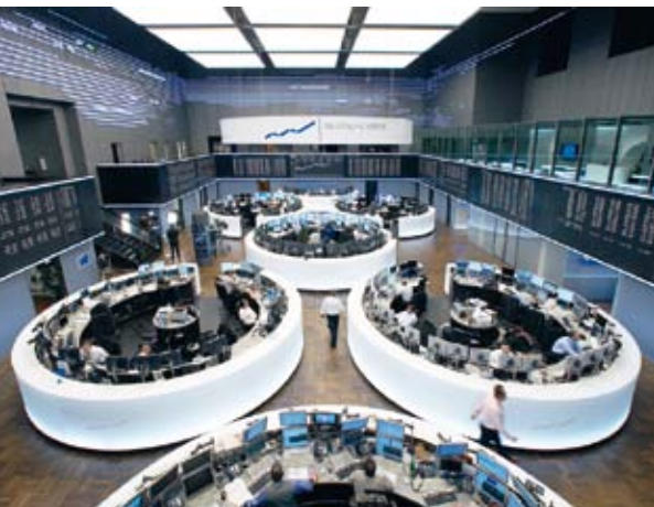
RUNDHERUM GELUNGEN: 2007 ERÖFFNET DER RUND- ERNEUERTE HANDELSAAL.